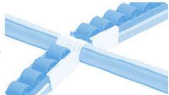
Variable Halter ST D28 Variable Holding Bracket ST D28